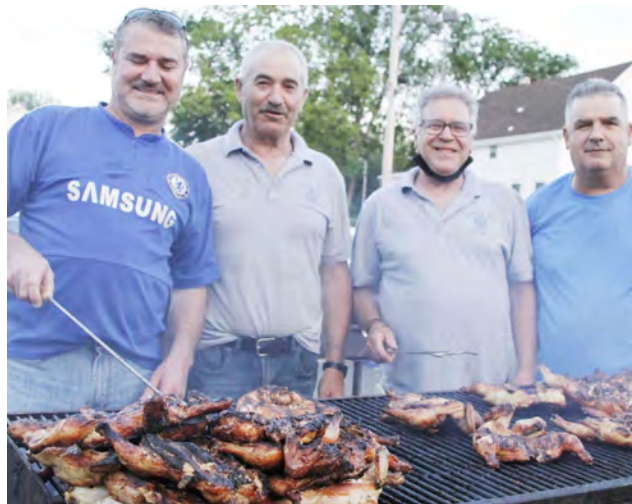
Festa da Irmandade do Espírito Santo do Phillip Street Hall em East Providence.

Se bem que o leque das atividades de verão prossiga, como esta semana retrata as Festas de Nossa Senhora do Rosário e Santo Cristo em Providence e para a semana as festas do Divino Espírito Santo da igreja de Santo António em Pawtucket.