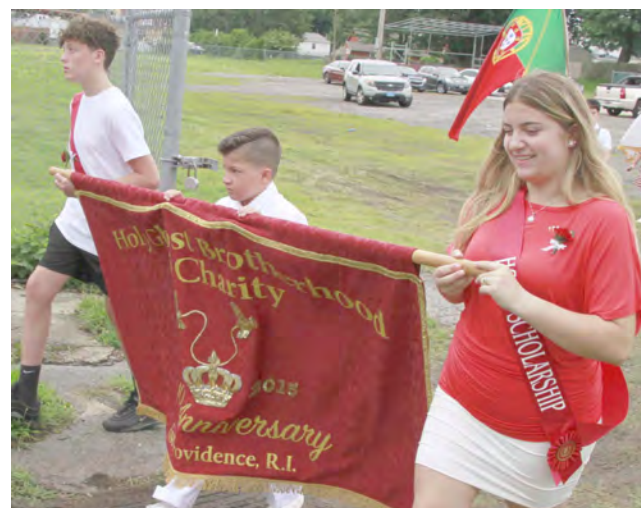
Nas restantes fotos aspetos da procissão.