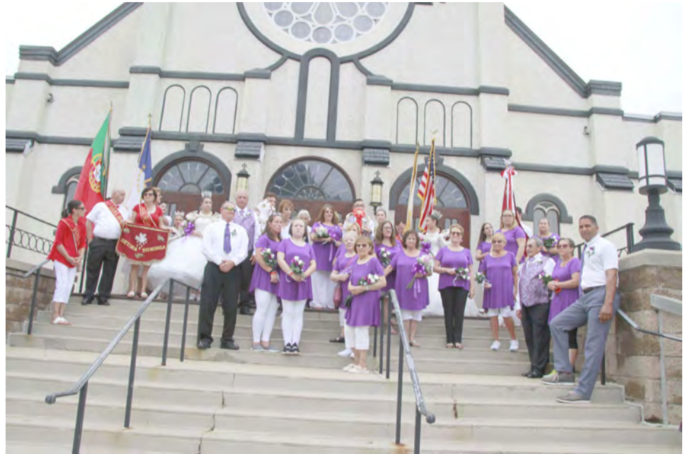
Na foto acima, mordomos e membros da Irmandade do Espírito Santo do Brightridge Club em frente à igreja de São Francisco Xavier em East Providence. Na foto abaixo, as senhoras responsáveis pela confeção da massa sovada.