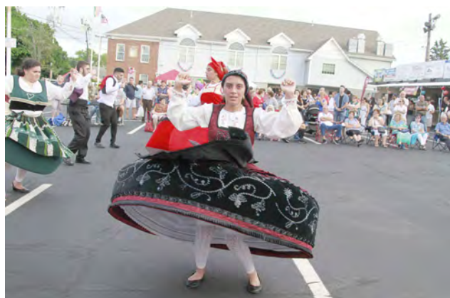
Festas sanjoaninas promovidas pelo Clube Juventude Lusitana em Cumberland.