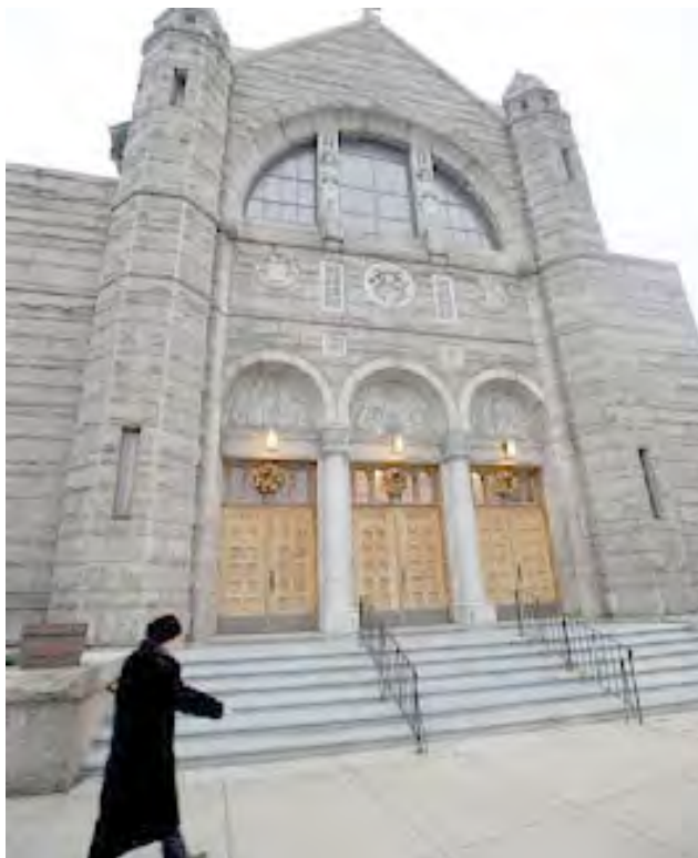
Igreja de São João Batista, New Bedford.

Em 2009 e 2010, o bispo Richard Lenon encerrou 50 paróquias da diocese de Cleveland num processo de fusão que resultou na formação de 18 novas paróquias e na venda de 26 igrejas para outras denominações religiosas, escolas e até um centro de reabilitação de toxicod dependentes. A diocese arrecadou 19 milhões de dólares, mas, se já tinha poucos paroquianos, ficou ainda com menos 87 mil, passando de 797 mil para 710 mil, pois muitas das pessoas cujas paróquias foram extintas recusaram