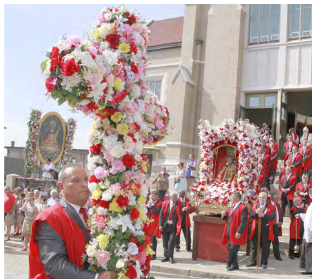
Festa do Senhor Santo Cristo em Fall River