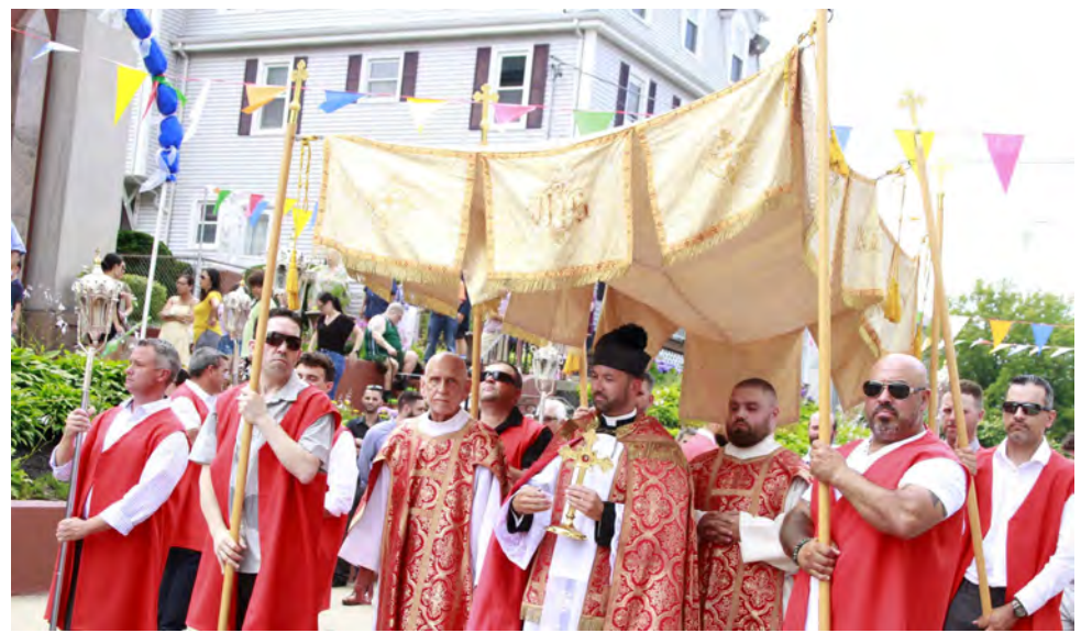
As fotos documentam a procissão da festa da igreja de São Miguel no passado domingo em Fall River.